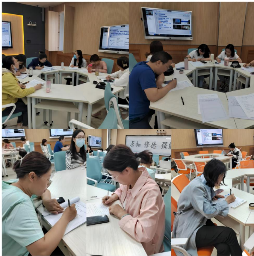
培训现场教师认真记录

培训现场，老师们认真学习并记录，大家纷纷表示，培训主题贴近教学实际，十分接地气，通过线上线下融合式教学相关内容的学习，获得了大量有益的经验，深受启发。