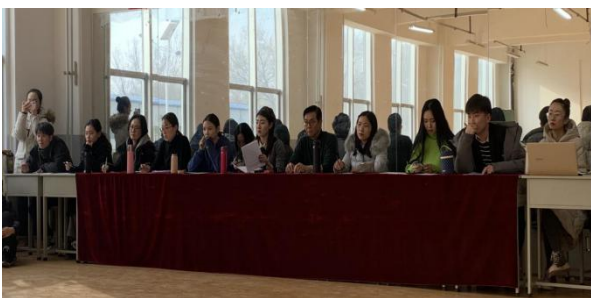
舞蹈教研室 许建宏/投稿

舞蹈教研室全体任课教师对本次期末考试进行了总结，对下学期的授课做出详细计划。同学们通过这次期末考试，反思自己的学习态度，发现学习问题，研究学习方法，调整学习策略，提高学习质量，实现了师生的共同进步。